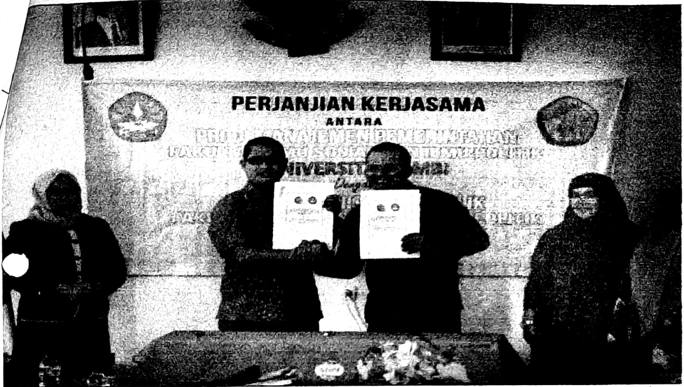
mandatangani Perjanjian Kerjasama Oleh Ketua Prodi Manajemen Pemerintahan Fisipol UNJA dengan Ketua Prodi Administrasi Publik Fisip UNRI