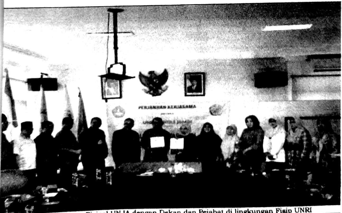
o Bersama Rombongan Fisipol UNJA dengan Dekan dan Pejabat di lingkungan Fisip UNRI