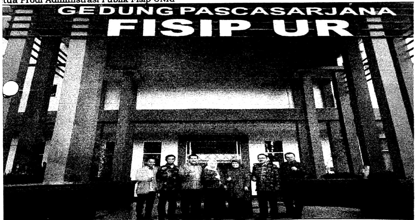
foto Bersama Rombongan Fisipol UNJA dengan Dekan dan Ketua Pasca Sarjana Fisip UNRI